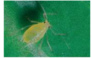
Die grüne Pfirsichblattlaus überträgt das zerstörerische Virus.

In der Zwischenzeit besteht die Gefahr, dass sich das Virus auch in Deutschland weiter verbreitet. Das Monitoring ergab seit dem Verbot der Neonicotinoide einen kontinuierlichen Anstieg der Blattlauspopulationen. Dieses Jahr gibt es bereits verstärkt Hotspots mit Virenbefall auf Feldern vor allem im Südwesten und Westen Deutschlands. Die Wirtschaftliche Vereinigung Zucker hat daher den Antrag gestellt, Neonicotinoide per Notfallzulassung für den Zuckerrübenanbau temporär wieder zuzulassen.