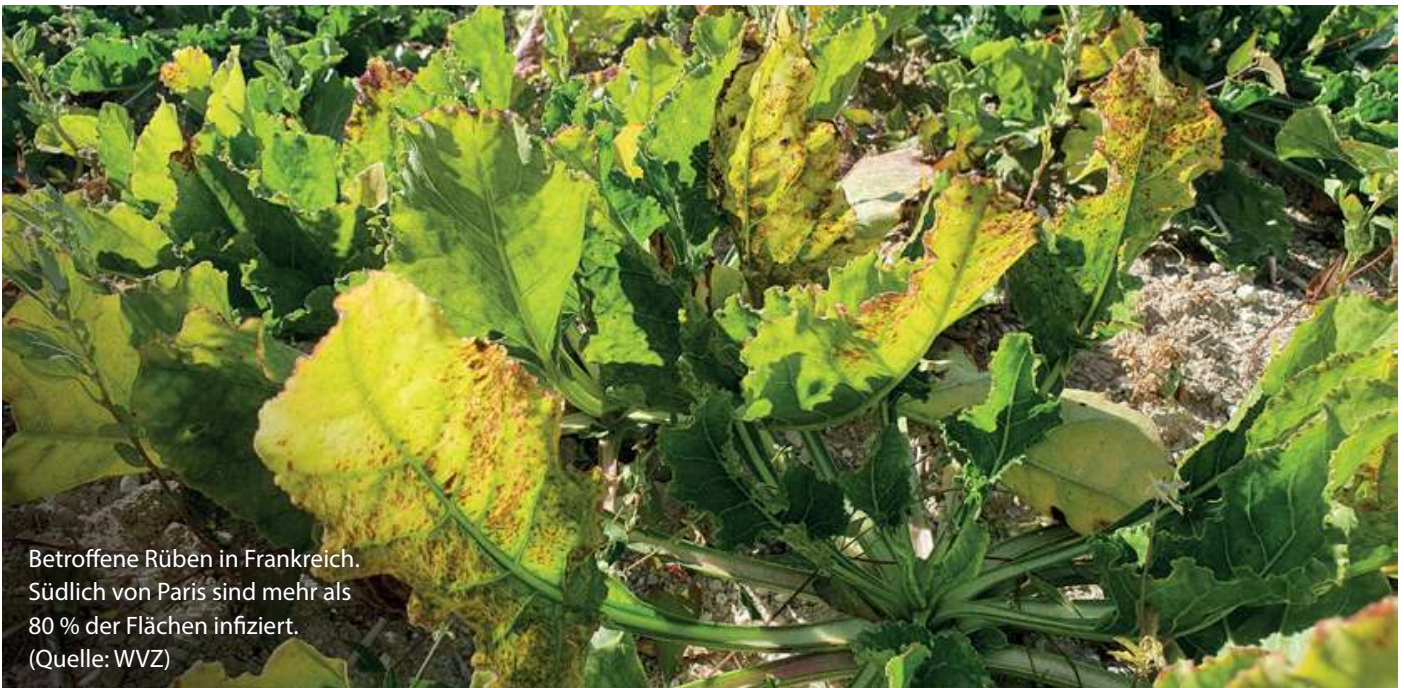
Betroffene Rüben in Frankreich. Südlich von Paris sind mehr als 80 % der Flächen infiziert.

In Frankreich ist das Vergilbungsvirus auf die Zuckerrübenfelder zurückgekehrt. Es drohen Ertragseinbußen von 150 bis 200 Millionen Euro. Auch in Deutschland sind immer mehr Flächen betroffen. Die deutschen Rübenanbauer sind alarmiert.