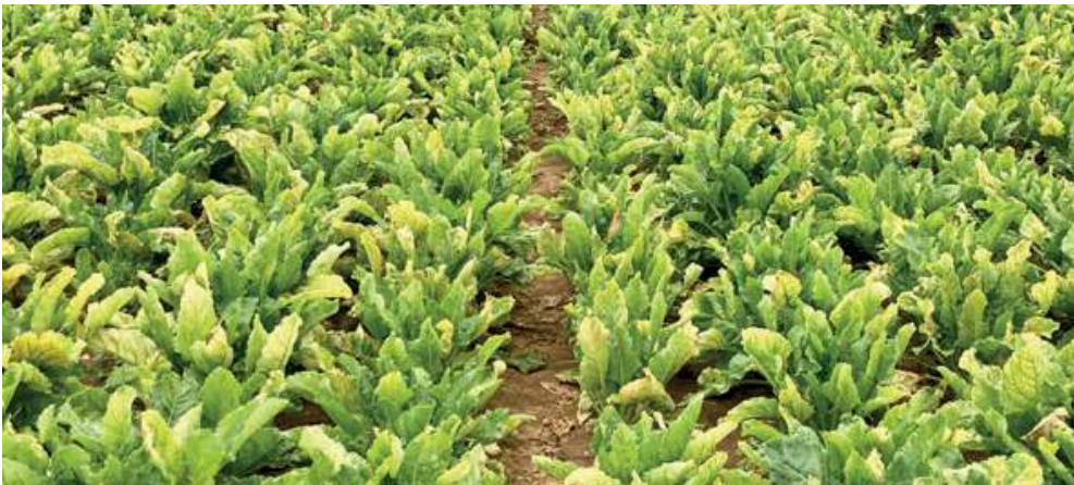
(Rübenfeld in Frankreich)