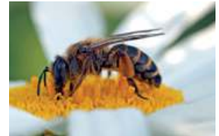
Wildbiene beim Bestäuben

Andernfalls zwingen die Wettbewerbsnachteile hiesige Landwirte dazu, den Anbau aufzugeben und damit die Zuckerindustrie, weitere Werke zu schließen. Das würde die Biodiversität auf dem Acker verschlechtern, die Wirtschaft im ländlichen Raum schädigen und Arbeitsplätze zerstören.